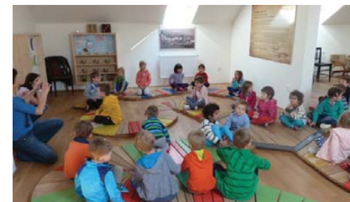
Jaro v MŠ

Dnes vás zdraví také děti z mateřské školy. Rády bychom se s vámi podělily o naše jarní zážitky z MŠ. Od září se nám prodloužily nožičky a v MŠ jsme zvyklé na určitá pravidla a režim. Jenom pro některé nejmladší „Hvězdičky“ se ranní odloučení od rodičů občas neobejde bez slziček. Paní učitelky vnímají, jak náročné období musí dvouleté děti překonat, když se nástup dětí do MŠ posouvá stále do nižšího věku. Dříve bylo o tyto děti pečováno v jeslích. Zde pracovaly vychovatelky, z nichž alespoň jedna musela