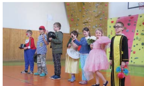
Den Jazyků